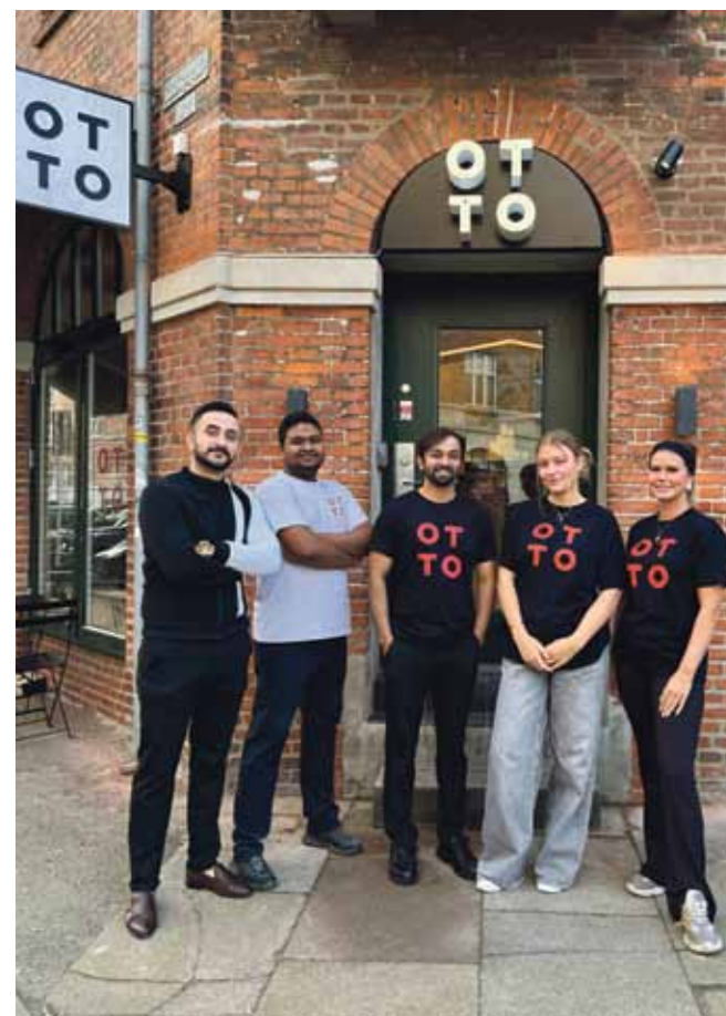
Efter en forsinket ombygning er Otto åbnet på Islands Brygge.

Nu er både dej og ovn rykket ind i de nye lokaler i Snorresgade.