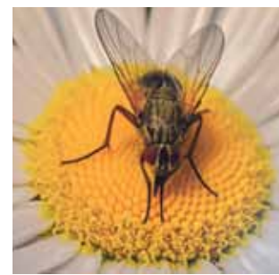
Kom tæt på biller, insekter og andet kryb i ny fotoudstilling.

► "En summende udstilling" kan opleves gratis i Christianshavns Beboerhus i Dronningensgade 34 frem til den 28 februar i husets åbningstid. og voksne i alle aldre.