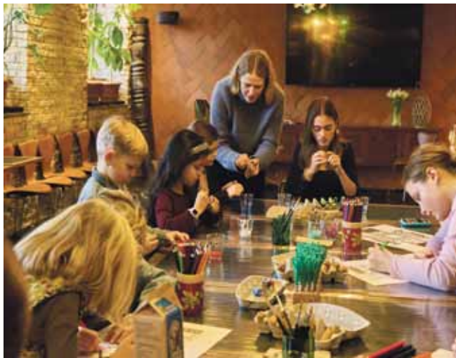
Hold børnene beskæftiget med bæredygtige krea-projekter mens forældrene nyder en søndagsbrunch.

Hold børnene beskæftiget og få ro til at nyde en rolig søndagsbrunch på Hotel Guldsmeden. Hver søndag kan hele familien få en hyggelig formiddag med god mad og aktiviteter til ungerne.