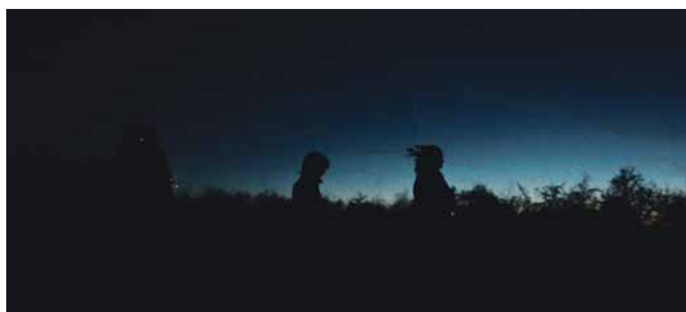
Tag på vandring i mørket på Amager Fælled.

► Mørkevandring på Amager Fælled den 24. februar klokken 17.34 ved DR-Byen metrostation. Billetter koster 75 kroner og kan købes på Billetto. Turen er for voksne over 18 og er desværre ikke egnet for gangbesværede. Mørkevandringen er arrangeret i samarbejde med Miljøpunkt Amager med støtte fra Amager Vest Lokaludvalg.