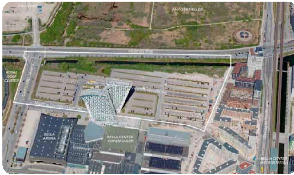
Lokalplansafgrænsning Bella Kvarter Nord.

Derfor opfordrer lokaludvalget til, at kommunen tager de trafikale udfordringer alvorligt og integrerer løsninger, der gavner både nuværende og kommende beboere i og omkring Bella Center Nord og Fælledby.