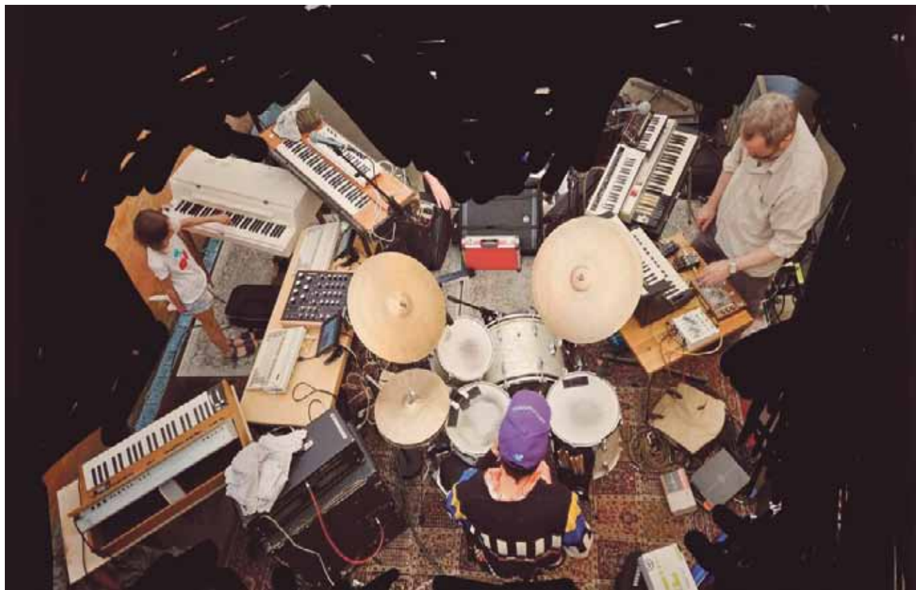
Hippie Da Da genopstår i Kulturhuset Islands Brygge.

► Hippie Da Da i Kulturhuset Islands Brygge den 21. februar klokken 20. Billetter koster 100 kroner og kan købes på Billetto.